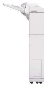
UNIDAD DE INSERCIÓN DE DOCUMENTOS P1