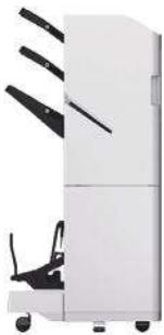
FINALIZADOR DE FOLLETOS V1