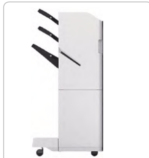
FINALIZADOR ENGRAPADOR V1