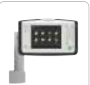
PANEL DE CONTROL VERTICAL E1