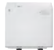
ALIMENTADOR POR VOLUMEN DE POD LITE C1