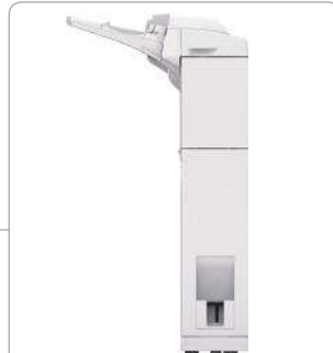
UNIDAD DE INSERCIÓN DE DOCUMENTOS/DOBLADORA J1